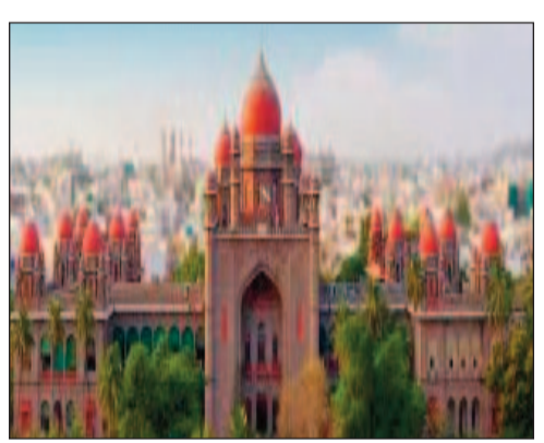
నిర్ణయం తీసుకునే వరకు మనీ లాండరింగ్ కేసు విచారణను వాయిదా వేయాలని ట్రయల్ కోర్టుకు సూచించింది. తదుపరి విచారణను వచ్చే సోమవారానికి వాయిదా వేసింది.

ఈరోజు హైకోర్టు వివరణ జరిపింది. ఈ విచారణలో భాగంగా ధర్మాసనం కేజ్రీవాల, కవిత, సిసోడియాతో పాటు మిగిలిన నిందితులందరికీ నోటీసులు జారీ చేసింది. సీబీఐ దాఖలు చేసిన ఈ రివిజన్ పిటిషన్ పై వివరణ ఇవ్వాలని ఆదేశించింది. విచారణ సందర్భంగా సీబీఐ తరపున హాజరైన సాల్వేటర్ జనరల్ తుషార్ మెహతా వాదనలు వినిపిస్తూ.. విచారణాధికారిపై కోర్టు చేసిన వ్యాఖ్యలు దర్వాప్త సంస్థల మనోధైర్యాన్ని దెబ్బతీసేలా ఉన్నాయని పేర్కొన్నారు. దీనిపై స్పందించిన హైకోర్టు, దర్వాప్త సంస్థ, విచారణాధికారిపై ట్రయల్ కోర్టు చేసిన ప్రతికూల వ్యాఖ్యలపై స్టే విధిస్తూ కీలక ఉత్తర్వులు జారీ చేసింది. అంతేకాకుండా, సీబీఐ కేసులో నిందితులు విడుదలయ్యారు కాబట్టి ఈడీ దాఖలు చేసిన మనీ లాండరింగ్ కేసు విచారణను కూడా నిలిపివేయాలని నిందితుల తరపు న్యాయవాదులు కోరగా.. హైకోర్టు భిన్నంగా స్పందించింది. సీబీఐ రివిజన్ పిటిషన్ పై