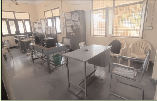
11.30 గంటలు దాటినా కార్యాలయానికి ఒక్క అధికారి కూడా రాకపోవడంతో గ్రామాల నుంచి వచ్చిన ప్రజలు తీవ్ర అసహనం వ్యక్తం చేశారు. వివిధ పనుల కోసం మండలంలోని గ్రామాల నుంచి వచ్చిన ప్రజలు గంటల తరబడి ఎంపీడివో కార్యాలయం వద్ద వేచి ఉంటున్నారని

పరిస్థితి ఏర్పడింది. కార్యాలయంలో కేవలం తాత్కాలిక పద్ధతిలో పనిచేస్తున్న కొంతమంది ఉద్యోగులు మాత్రమే హాజరై ఉండగా, కీలక బాధ్యతలు నిర్వహించే అధికారులు గైర్హాజరులోనే ప్రజలు తెలిపారు. ఎంపీడివో కార్యాలయంలో ముఖ్యమైన బాధ్యతలు నిర్వహించే ఎంపీడివో, సూపరింటెండెంట్, సీనియర్ అసిస్టెంట్, కంప్యూటర్ ఆపరేటర్ సైతం సమయానికి కార్యాలయానికి హాజరు కాకపోవడం అధికారుల నిర్లక్ష్యానికి నిదర్శనమని ప్రజలు విమర్శిస్తున్నారు. ఇటీవలి రోజులుగా అధికారుల సమయపాలన తీరు ఇదే విధంగా కొనసాగుతోందని ప్రజలు ఆరోపిస్తున్నారు. ఈ విషయంపై పలు సార్లు అధికారులను వివరణ కోరగా సరైన సమాధానం ఇవ్వడం లేదని అసంతృప్తి వ్యక్తం చేస్తున్నారు. అధికారులు సమయపాలన పాటించినా ప్రజలకు అందుబాటులో ఉండాలని ప్రజలు, ప్రజాప్రతినిధులు కోరుతున్నారు.