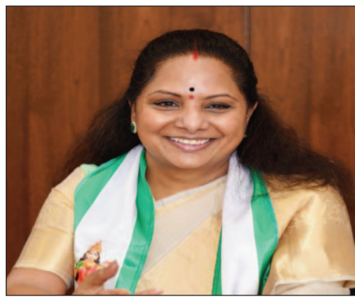
ఇవ్వాలని ఆమె డిమాండ్ చేశారు. బాధితులకు న్యాయం జరిగే వరకు, సమస్యకు శాశ్వత పరిష్కారం దొరికేంత వరకు ప్రభుత్వంపై ఒత్తిడి తెస్తానని కవిత స్పష్టం చేశారు.

కల్పకుంట్ల కవిత ఇవాళ పరామర్శించారు. ఇళ్లు కోల్పోయి కన్నీరు పెట్టుకుంటున్న మహిళలను చూసి ఆమె చలించిపోయారు. ఈ సందర్భంగా కవిత మాట్లాడుతూ.. ఆడబిడ్డల దుఃఖం, వారి కన్నీళ్లు ప్రభుత్వానికి మంచిది కాదని హెచ్చరించారు. “నేను టూరిస్టును కాదు. మీ సమస్యకు పరిష్కారం చూపేవరకూ ఇక్కడే ఉండి పోరాడతా” అని కవిత బాధితులకు భరోసా ఇచ్చారు. జిల్లా కలెక్టర్, మంత్రులు తక్షణమే వెలుగుమట్లకు వచ్చి బాధితులతో మాట్లాడి, వారి సమస్యలకు పరిష్కారం చూపాలని డిమాండ్ చేశారు. పేదల ఇళ్లపై బుల్డోజర్ల పంపడం అన్యాయమని మండిపడ్డారు. కొన్ని రాజకీయ పార్టీలు ఈ దుఃఖాన్ని కూడా రాజకీయం కోసం వాడుకుంటున్నాయని ఆమె ఆరోపించారు. గతంలో బీఆర్ఎస్ వాళ్లు కూడా ఇళ్లు కూల్చడానికి ప్రయత్నాలు చేశారని కవిత అన్నారు. ఎక్కడైతే ఇళ్లు కూల్చేవారో అక్కడే తిరిగి స్థలాలు ఇచ్చి, ప్రభుత్వమే ఇళ్లు నిర్మించి