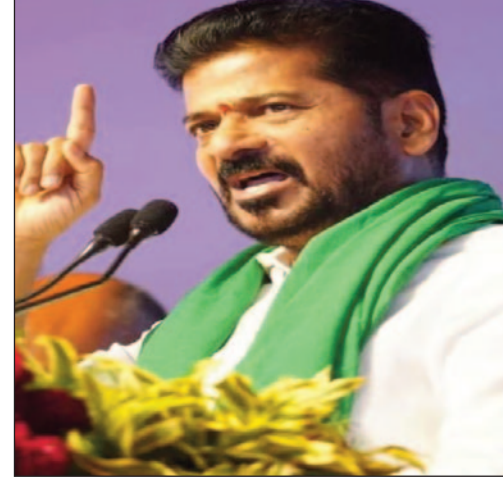
అంతర్జాతీయ స్థాయికి తీసుకెళ్లడమే ఈ స్పోర్ట్స్ యూనివర్సిటీ ప్రధాన ఉద్దేశమని ప్రభుత్వం వెల్లడించింది.