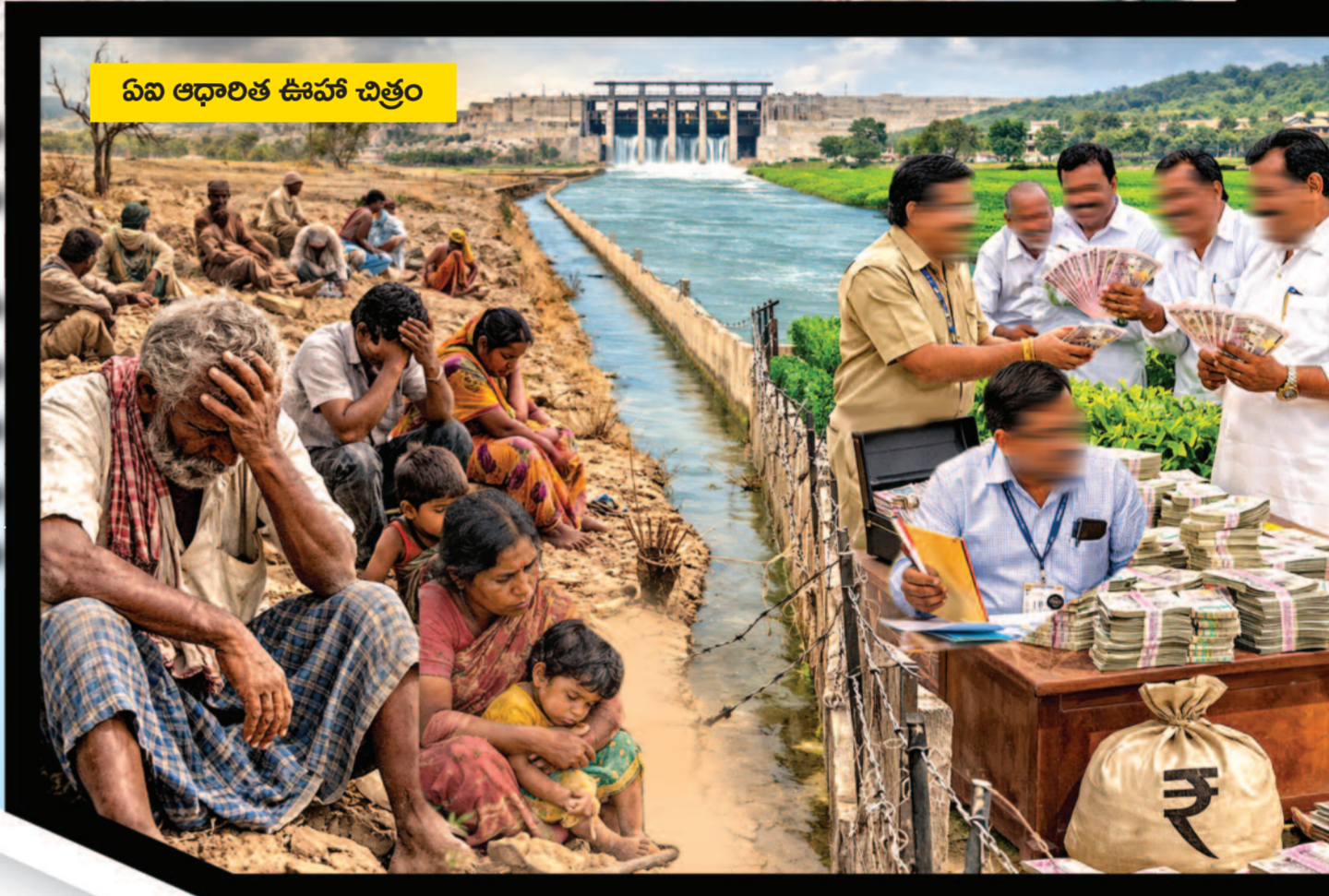
ఏవ ఆధారిత ఊహా చిత్రం

ఖమ్మం జిల్లా రేలకాయలపల్లి రెవెన్యూ పరిధిలో భాగోతం