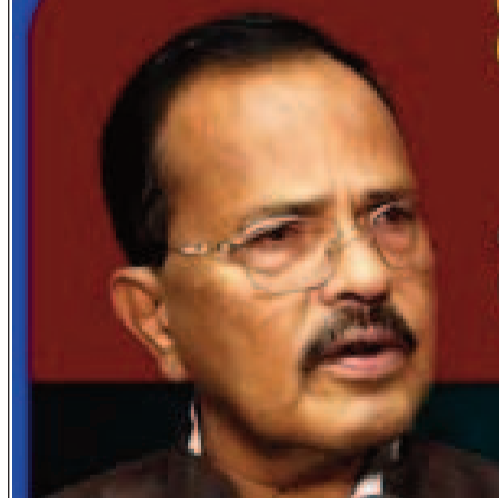
ఒక్కటి ఇచ్చారని అన్నారు. ముఖ్యమంత్రి రేవంత్ రెడ్డిపై తమకు ఎలాంటి కోపం లేదని, కానీ తమ సమస్యల పరిష్కారానికి కృషి చేయాలని కోరారు.

కోసం అమరులైన వారి కుటుంబాలకు ఆర్థిక సహాయం కోసం అడుగుదామని ప్రయత్నిస్తే కలవడానికి అవకాశం రావడం లేదని అన్నారు. ఐదు ఎకరాల భూమి ఇస్తే తాము మాదిగ భవనం నిర్మించుకుంటామని తెలిపారు. ఈ రెండున్నరేళ్ల కాలంలో తమ వర్గానికి అన్ని చోట్ల అన్యాయమే చేశారని ఆరోపించారు. నిన్న జరిగిన మాదిగల సన్మాన సభకు తనను పిలవలేదని ఆవేదన చెందారు. ముఖ్యమంత్రి తనను పిలవలేదు కాబట్టి నిర్వాహకులు కూడా పట్టించుకోలేదేమో అని వాపోయారు. తాను కూడా కాంగ్రెస్ పార్టీలోనే ఉన్నానని, ఎంతకాలమైనా ముఖ్యమంత్రి పదవిలో ఉండు... నిన్ను మా భుజాన మోస్తాం అని రేవంత్ రెడ్డితో చెప్పానని, కానీ ఆయన మాత్రం తనకు అపాయింట్మెంట్ కూడా ఇవ్వడం లేదని వాపోయారు. మాదిగ కులాన్ని రేవంత్ రెడ్డి పట్టించుకోడం లేదని ఆరోపించారు. పార్లమెంట్ ఎన్నికల్లో, రాజ్యసభ, ఎమ్మెల్యే, ఎమ్మెల్యే ఎన్నికల్లో మాదిగలకు ప్రాధాన్యత ఇవ్వలేదని ఆరోపించారు. వందల కార్పొరేషన్లు ఏర్పాటు చేశారని, కానీ మాదిగలకు మాత్రం