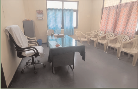
సర్పంచలపేట, మార్చి 9 (షేషుల్స్ డైలీ) : మహబూబాబాద్ జిల్లా సర్పంచలపేట మండల కేంద్రంలోని ఎంపీడివో కార్యాలయంలో అధికారులు సమయపాలన పాటించకపోవడంపై ప్రజలు, ప్రజాప్రతినిధులు తీవ్ర ఆగ్రహం వ్యక్తం చేస్తున్నారు. సోమవారం ఉదయం

ఉదయం 11 దాటినా ఆఫీసుకు రాని వైనం - ఎంపీడివో కార్యాలయ సిబ్బందిపై ప్రజల ఆగ్రహం